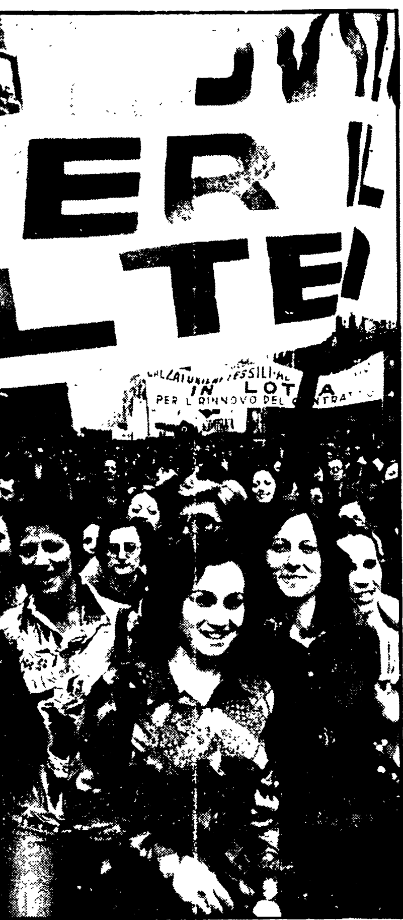
Un'immagine di una recente manifestazione di tessili