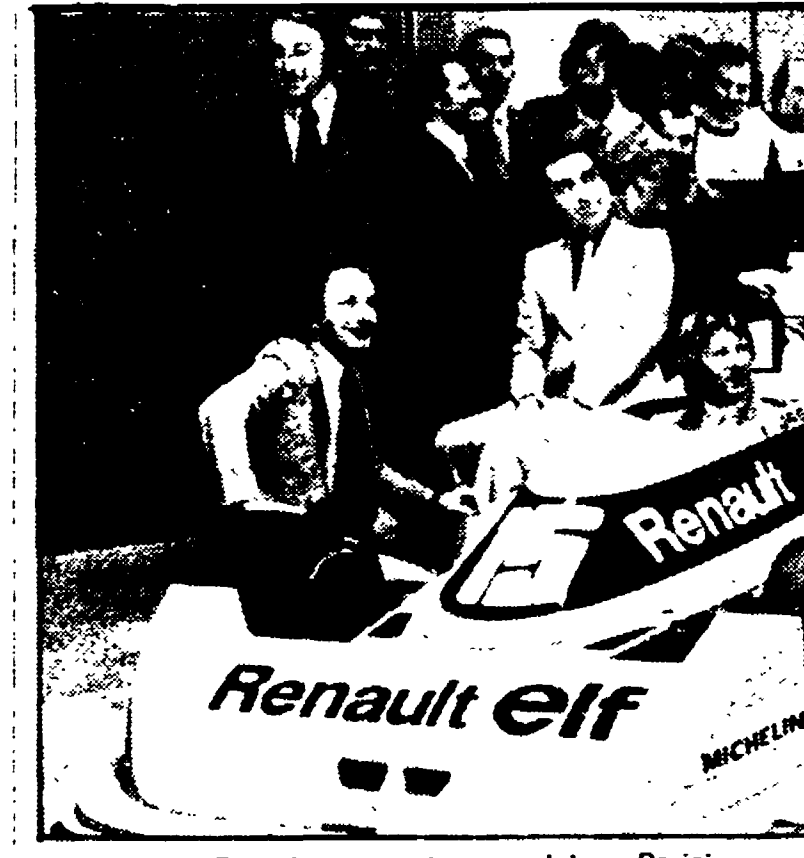
La nuova Renault monoposto presentata a Parigi

PARIGI — Una nuova «Formula 1» verrà presto ad aggiungersi al già nutrito lotto di monoposto che si contendono al campionato del mondo conduttori: si tratta della Renault-F1, presentata ufficialmente solo pochi giorni fa.