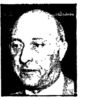
SPAGNOLI - Evitare il « giorno per giorno »

Il problema — ha osservato Barca — resta quello di « come produrre più risorse e come aumentare il numero degli occupati effettivi riducendo gradualmente il tasso di inflazione e difendendo il tasso di cambio ».