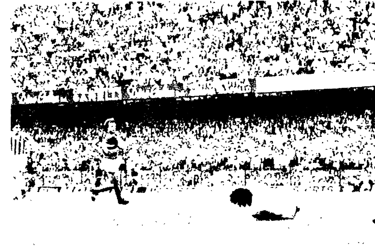
Tra immagini di Sampdoria Juventus in alto il gol con un pregevole colpo di tacco di Bettega. Nella foto a fianco il giocatore esultante attorniato dai tifosi alla fine della partita. Nella terza foto la rete del 2-0 siglata con un gran tiro da Boninsegna, undicesimo gol in campionato per il centravanti.

DALLA REDAZIONE GENOVA - Il derby è una gara di grande interesse. I bianconeri, che hanno appena vinto la Coppa Italia, si sono presentati con un'attitudine di orgoglio e di classe che ha impressionato tutti. La Sampdoria, invece, ha fatto una partita di routine, con un gioco poco brillante e una difesa poco solida. La partita è stata decisa nel primo tempo, quando Bettega e Boninsegna hanno segnato i due gol della vittoria. I bianconeri hanno dominato la partita, con un possesso palla superiore a quello dei sampdoria. I campioni d'Italia hanno mostrato un'ottima tecnica e una grande classe, che ha permesso loro di superare con facilità i difensori della Sampdoria. La partita è stata giocata in un'atmosfera di grande tensione, con i tifosi bianconeri che hanno fatto un'ottima figura. La Sampdoria, invece, ha fatto una partita di routine, con un gioco poco brillante e una difesa poco solida. La partita è stata decisa nel primo tempo, quando Bettega e Boninsegna hanno segnato i due gol della vittoria.