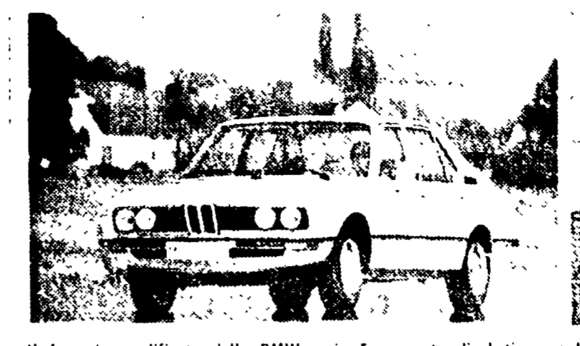
Il frontale modificato della BMW serie 5 consente di distinguere le vetture dai tipi della serie 3...