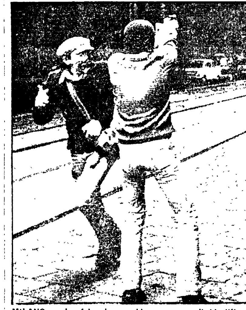
MILANO - La foto che avrebbe permesso di identificare uno degli sparatori, quello che appare di spalle

Uno di essi sarebbe il giovane che le foto pubblicate da molti giornali ritraevano con una pistola in mano, in via De Amicis - E' stato ricostruito l'agguato alla pattuglia della polizia - Massimo riserbo da parte degli inquirenti