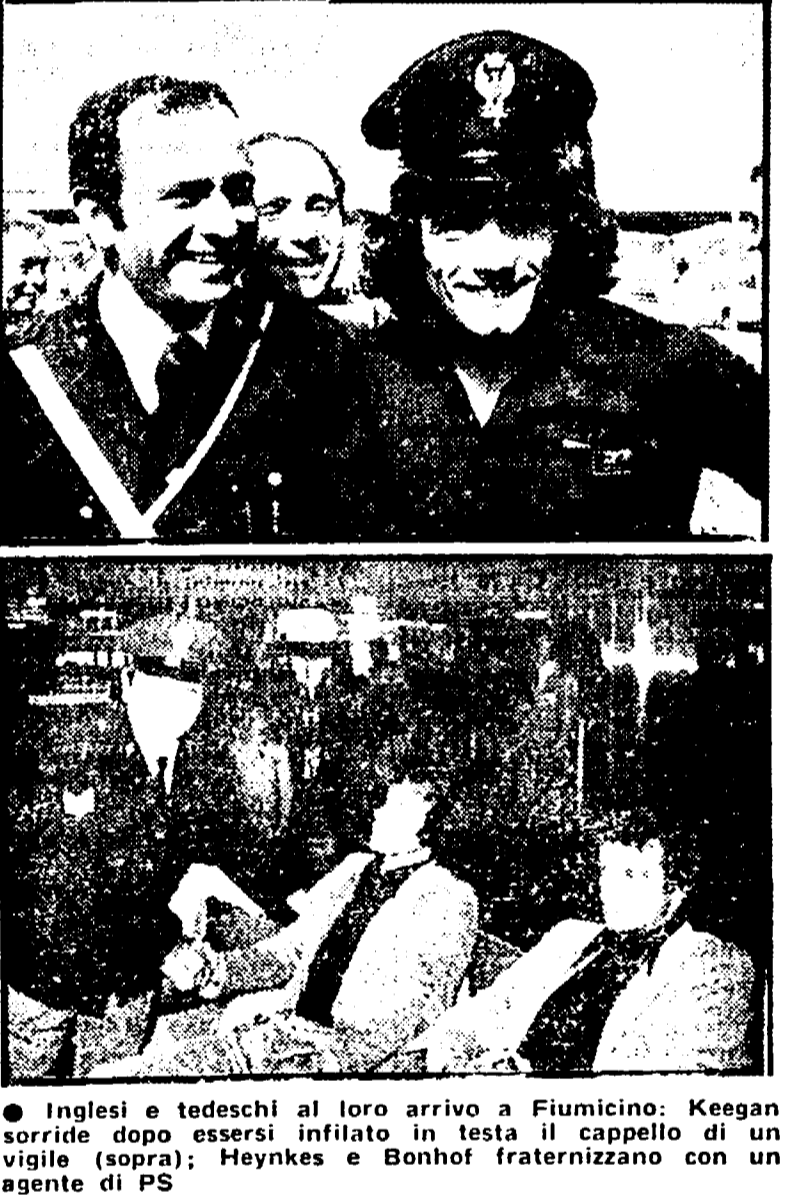
Inglese e tedeschi al loro arrivo a Fiumicino: Keegan sorride dopo essersi infilato in testa il cappello di un vigile (sopra); Heynkes e Bonhof fraternizzano con un agente di PS