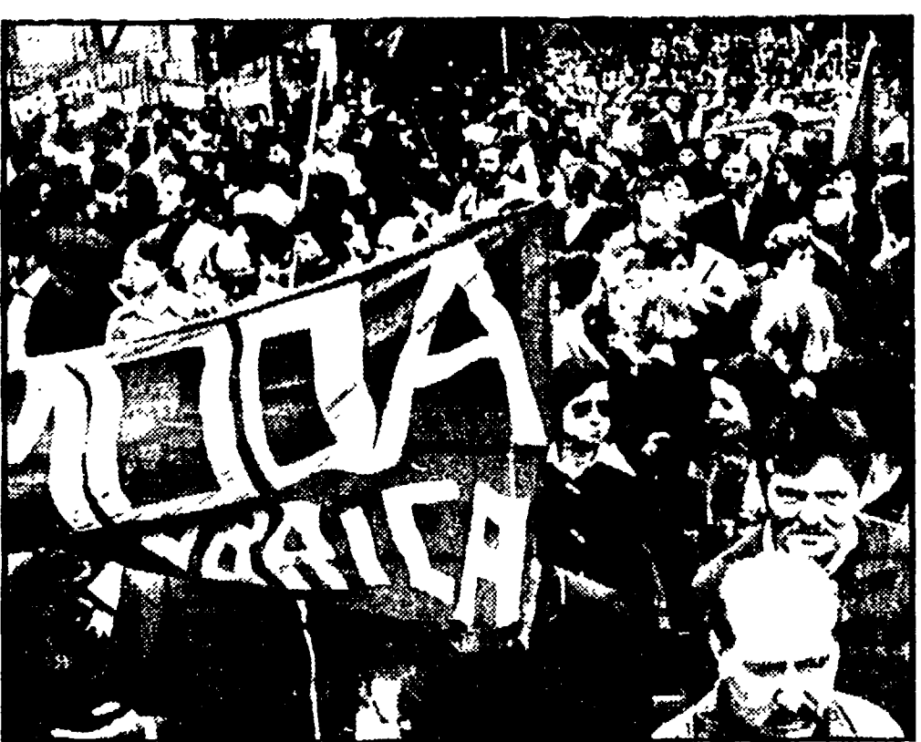
Lavoratori in corteo a Torino