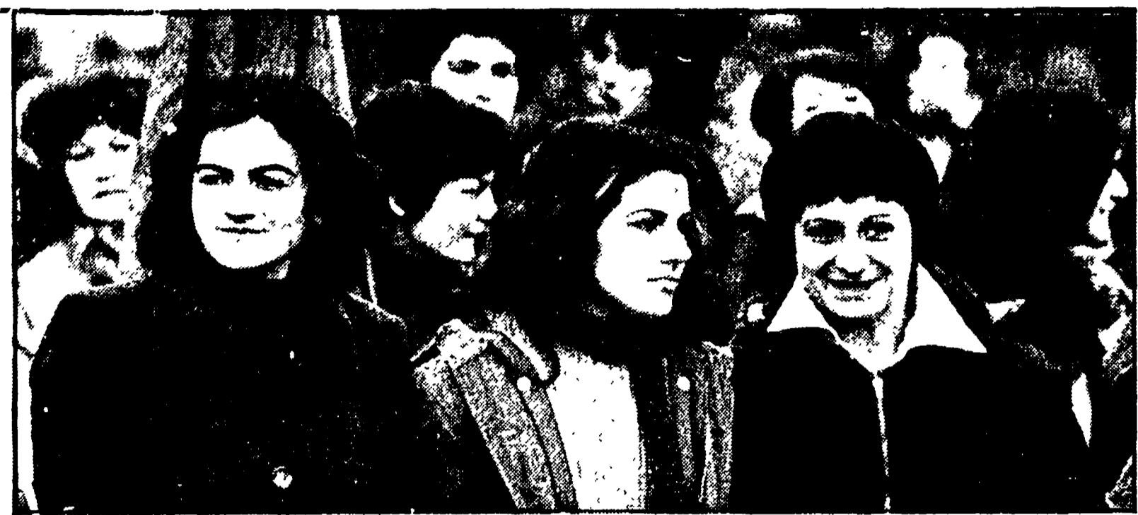
Giovani durante una recente manifestazione per l'occupazione

Tanti sono gli studenti e i disoccupati dai 15 ai 25 anni della provincia - Impegnate tutte le realtà interessate per avere un quadro completo della situazione occupazionale - Il lavoro partirà già dalla prossima settimana