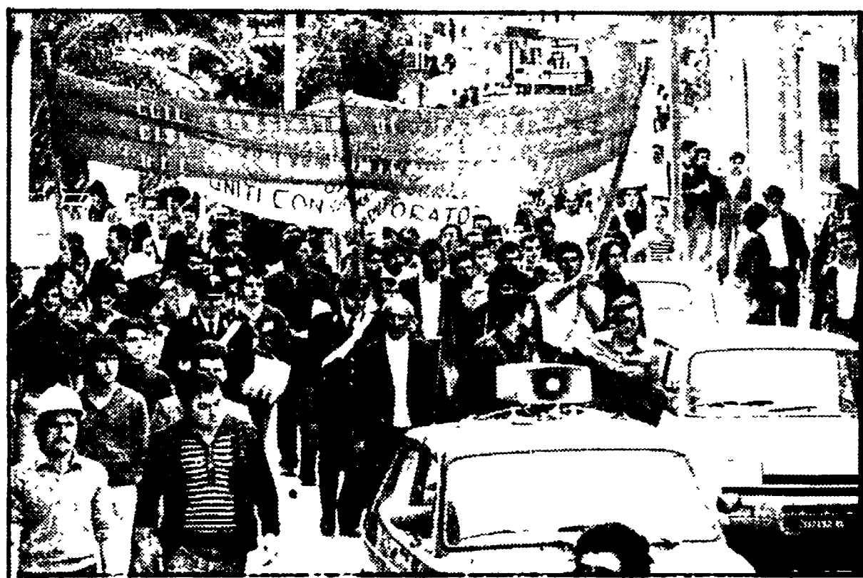
Manifestazione per la Lichichimica