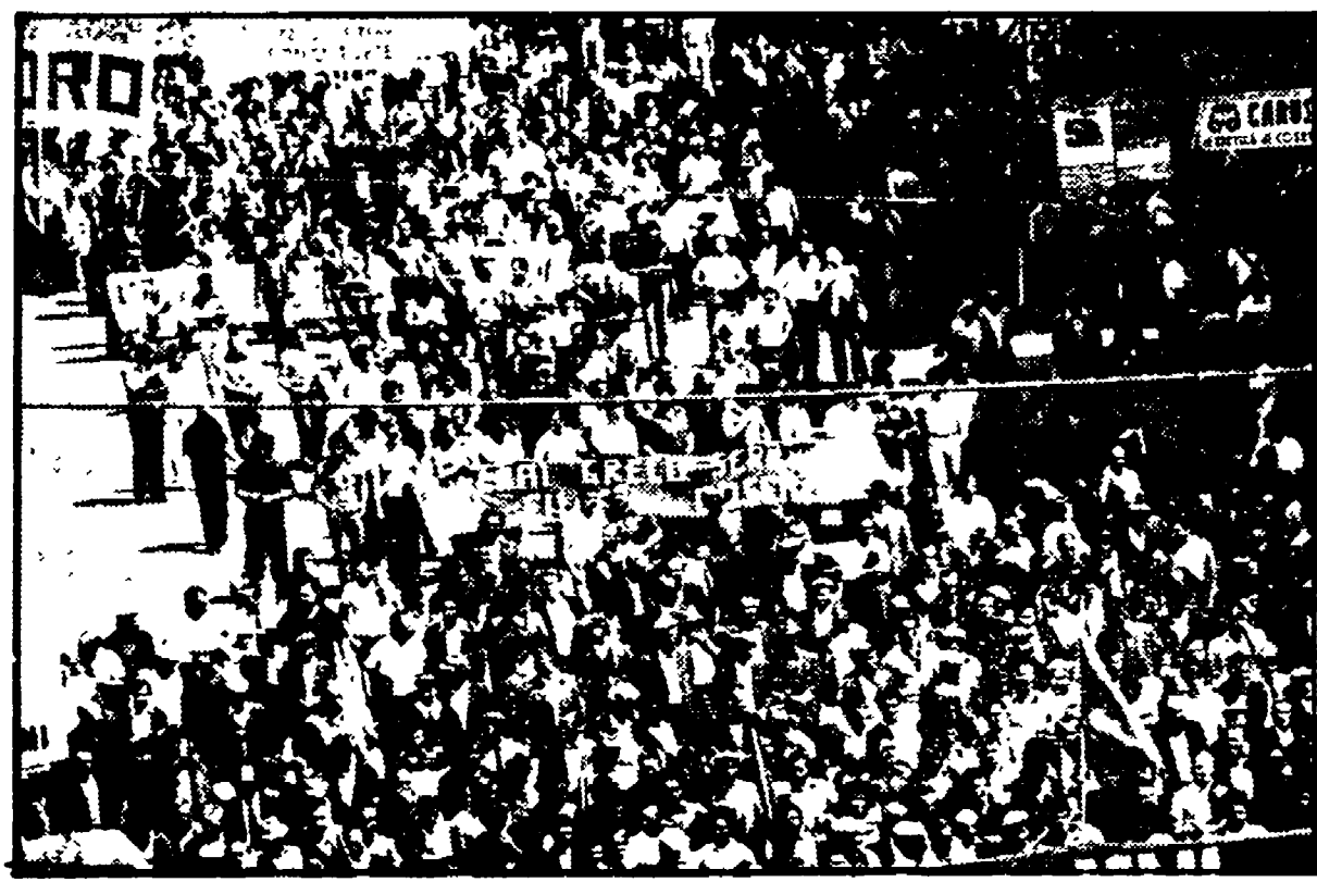
Due immagini dello sciopero generale a Cosenza e della manifestazione per la Lichichimica