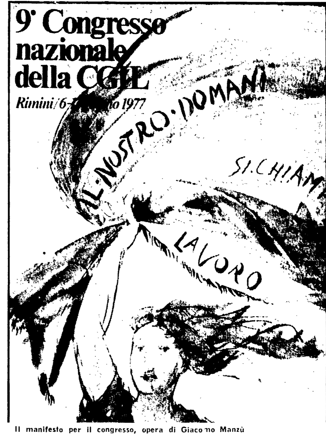
Il manifesto per il congresso, opera di Giacomo Manzù