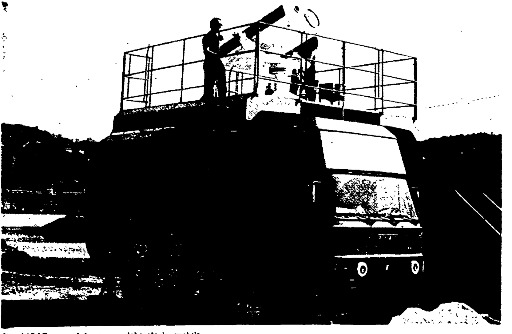
Il «LIDAR» montato su un laboratorio mobile

Alla proiezione del film vengono invitati anche quest'anno gli studenti delle scuole tecniche e professionali elettriche. Un'analoga campagna sarà effettuata prossimamente in Francia, in collaborazione con l'Ente elettrico francese, a cura della sezione di Nantes.