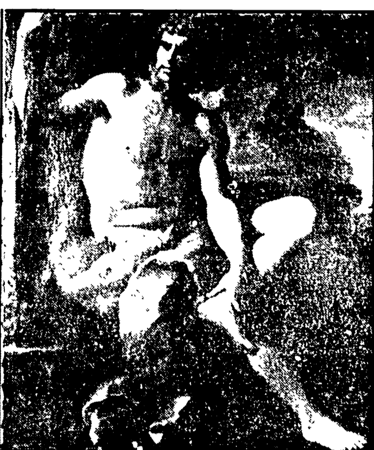
Un dipinto del '600 conservato nel Museo Civico di Pistoia

PISTOIA - Sabato 18 giugno il pubblico riprende l'attività pubblica del museo civico di Pistoia. La cerimonia inaugurale sarà preceduta venerdì 10 giugno alle ore 17 da una conferenza del professor Carlo Argan sul tema «La funzione del museo». La conferenza si terrà nella sala maggiore del Palazzo comunale.