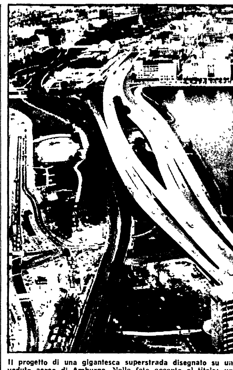
Il progetto di una gigantesca superstrada disegnato su una veduta aerea di Amburgo...