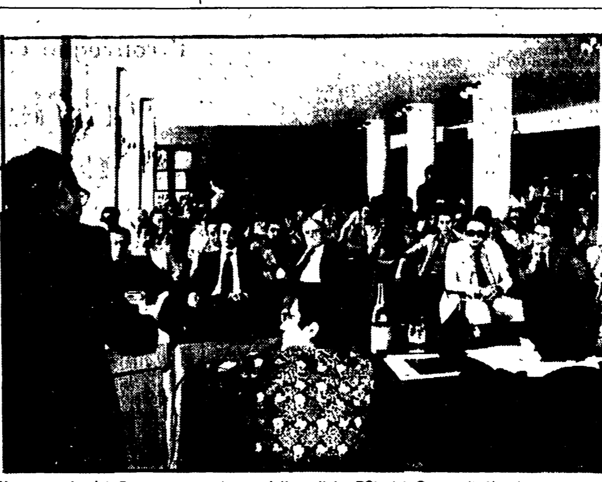
Un momento del Convegno organizzato dalla cellula PCI del Banco di Napoli

Se ne parla dai giorni del colera, ma ora, pare, siamo alla stretta finale. Una bozza del progetto speciale per il disinquinamento del Golfo di Napoli è stata approntata dalla Cassa per il Mezzogiorno il quale è, così com'è, esso rischia di cambiare ben poco, e anzi, per qualche aspetto di peggiorare la situazione.