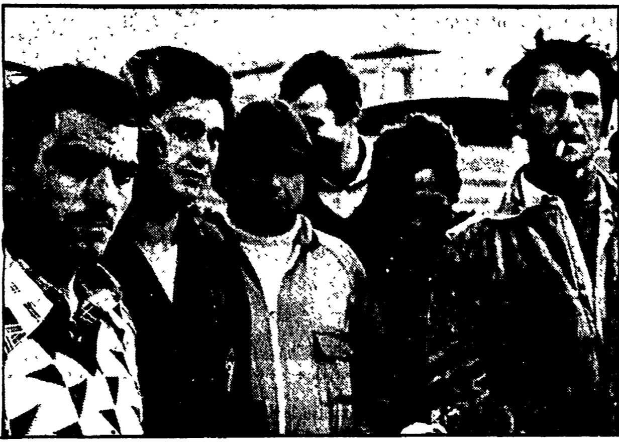
A sinistra, lavoratori del cantiere navale di Palermo; a destra, un'immagine interna dello stabilimento SIT-Siemens

Mercoledì manifestazione per difendere le strutture produttive più importanti: il cantiere, le aziende Sit-Siemens, le fabbriche ESPI - A colloquio con Mannino