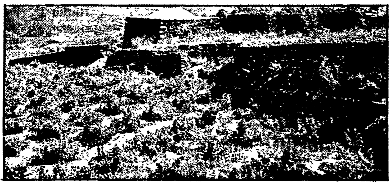
PANTELLERIA - Le coltivazioni dell'isola sono difese da piccole muraie