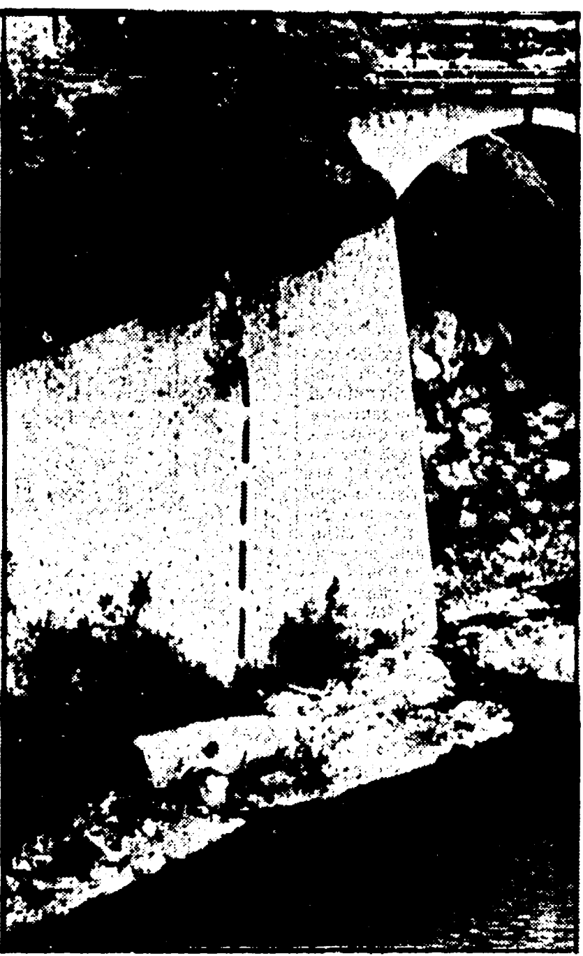
ALESSANDRIA — Il « volo » compiuto dall'autocisterna carica di tetracloruro di carbonio precipitata nello Scrivia

MILANO — Chi in Liguria riceve o chiama telefonicamente l'estero, da qualche giorno deve « passare » per la centrale di Milano. Sui « canali » della metropolitana lombarda, gli ingegneri del traffico internazionale, infatti, è stato dirottato l'afflusso telefonico proveniente dalle quattro province liguri. Motivo: centrale compartimentale genovese è stata chiusa per un'intossicazione che ha colpito gli addetti, provocata ma non è stato ancora accertato con sicurezza, da una disinfezione operata circa sette mesi fa quando i locali dell'azienda vennero irrorati con una sostanza, che, oltre ad emanare un cattivo odore provocava irritazioni agli occhi, prurito, nausea. Più colpite sono le donne, le « signorine del 14 », che costituiscono la stragrande maggioranza del personale.