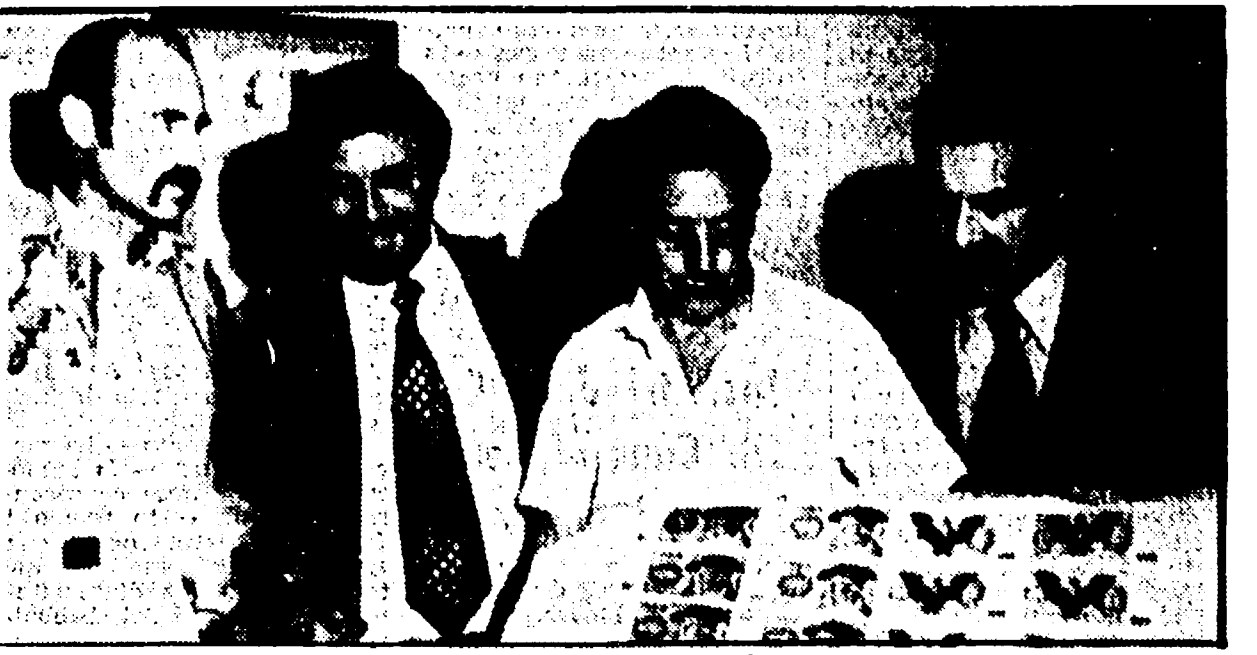
Bologna — Funzionari di polizia italiani e stranieri esaminano il materiale sequestrato

Dalla zecca clandestina di Bologna sono uscite banconote false spacciate in tutto il mondo - Una attrezzatura perfetta