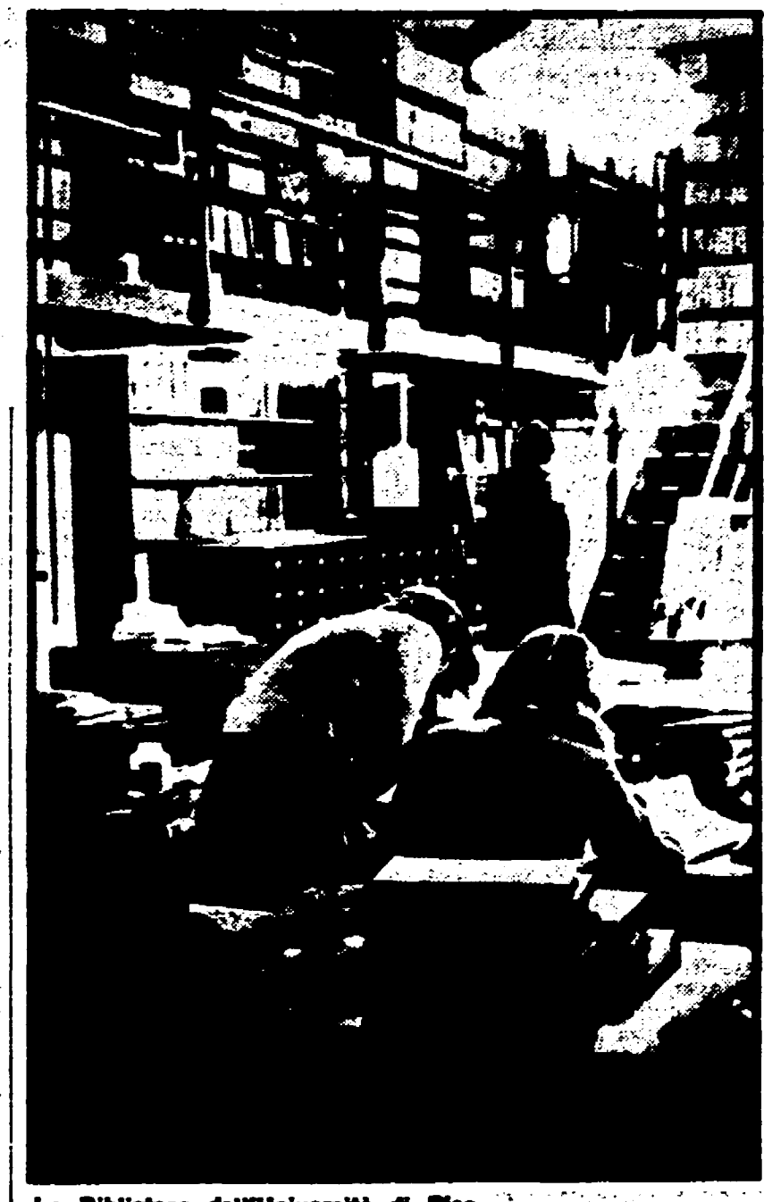
La Biblioteca dell'Università di Pisa

PISA — Nel documento che stamattina i rappresentanti degli studenti eletti nelle liste di «Unità studentesca» hanno ottenuto di poter leggere prima dell'avvio delle procedure della nomina del nuovo rettore dell'università di Pisa, sono contenute richieste precise relativamente agli impegni che dovranno essere assunti nella nuova gestione.