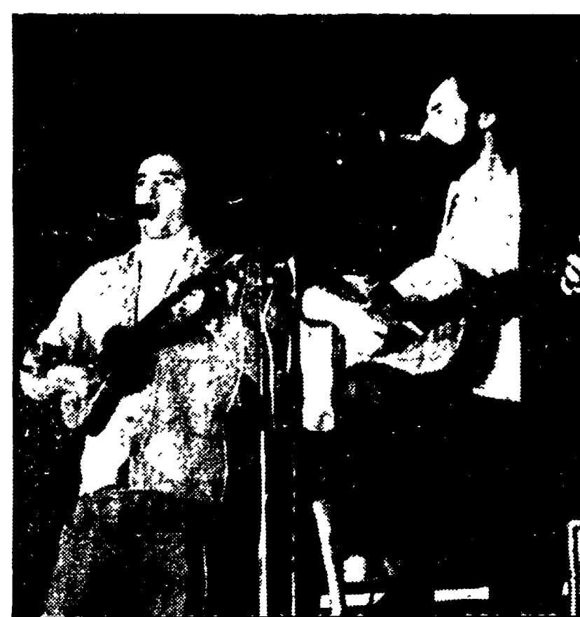
Nella foto in alto: Victor Manuel, sotto: il complesso «La Bullonera»

Migliaia e migliaia di giovani, cinquanta artisti, una intera serata di canzoni, musica e teatro: si può riassumere così la prima giornata dedicata alla democrazia e alla cultura in Spagna, organizzata da PCI e PCE, al Campo di Marte.