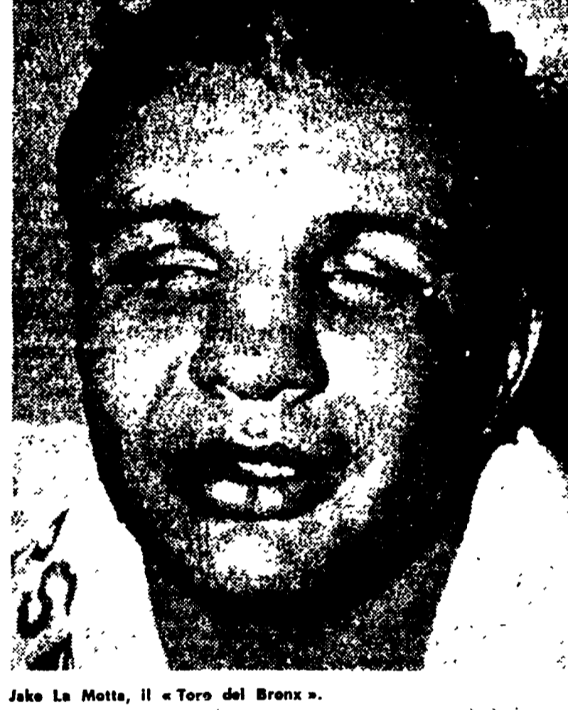
Jack La Motta, il «Toro del Bronx».