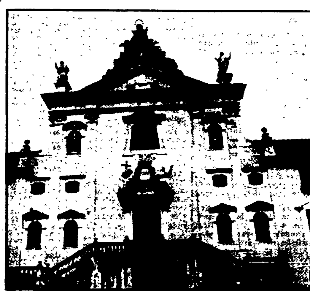
La Certosa di Calci

Stasera si esibirà la corale di Santa Cecilia che ai pezzi dei classici accompagnerà una serie di melodie e di canti popolari diverse regionali (italiane). Il 2 luglio sarà la volta della «orchestra sinfonica dell'ateneum» diretta dal maestro Samo Hubad che eseguirà quattro pezzi di Skerjanc, Rossini, Bartok e Beethoven. Il 6 agosto l'orchestra sinfonica sarà diretta dal maestro Mario Belardinelli al pubblico saranno offerte musiche di Rossini, Schubert, e Mozart.