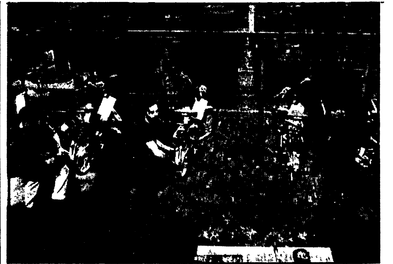
Un interno dello stabilimento Piaggio