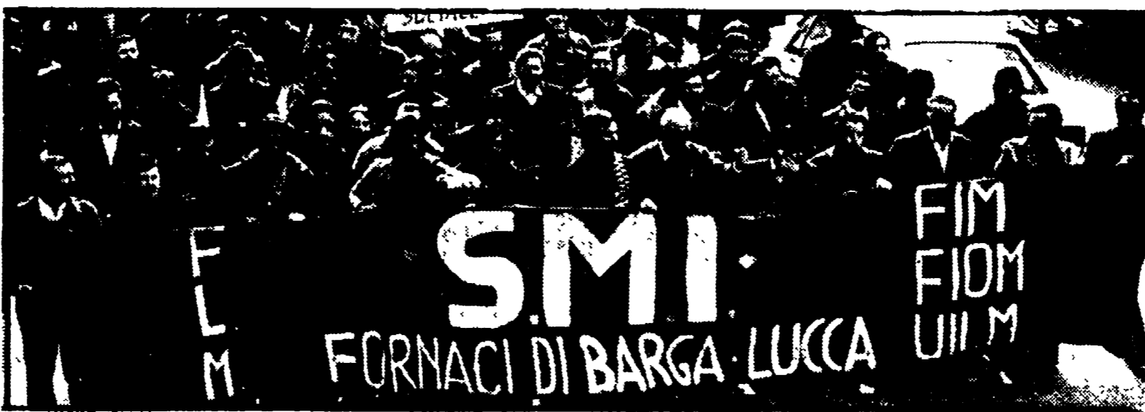
Una manifestazione dei lavoratori ex SMI dello scorso anno

Un gruppo di lavoratori parla della lettera inviata dal capo ufficio stampa dell'azienda La repressione in fabbrica e la tragedia dell'emigrazione forzata in Svizzera