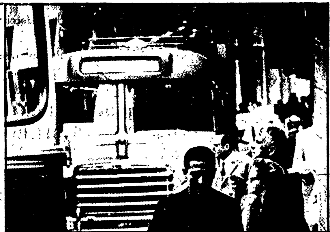
Un autobus attraversa il centro di Siena. Una immagine che i cittadini dimenticheranno presto

SIENA — A oltre sei mesi dall'entrata in vigore dei nuovi provvedimenti comunali che regolano la circolazione nel centro storico ed hanno allargato sensibilmente le isole pedonali, si cominciano a fare i primi bilanci. L'azienda di trasporti il TRAIN, è stata al centro di tutto il dibattito sui provvedimenti sul traffico.