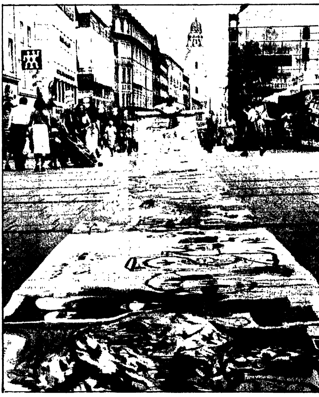
MONACO — Una pittura lunga quarantasei metri in un'area commerciale vietata al traffico. Il dipinto stradale è del pittore Alfred Darda ed è stato realizzato nel quadro di alcune iniziative culturali locali