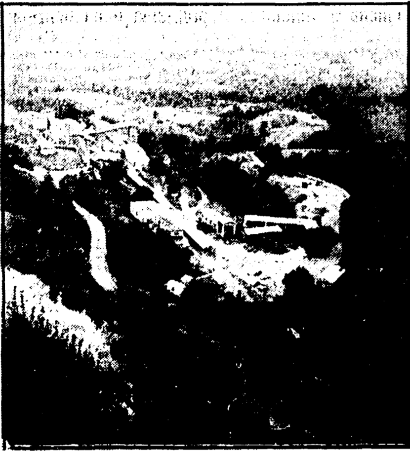
Selvina-Miniera del Morione

La riunione delle amministrazioni delle dieci comunità si è tenuta ad Abbadia S. Salvatore - Si richiede il rispetto degli accordi presi dal governo per la grave crisi economica che travaglia la zona