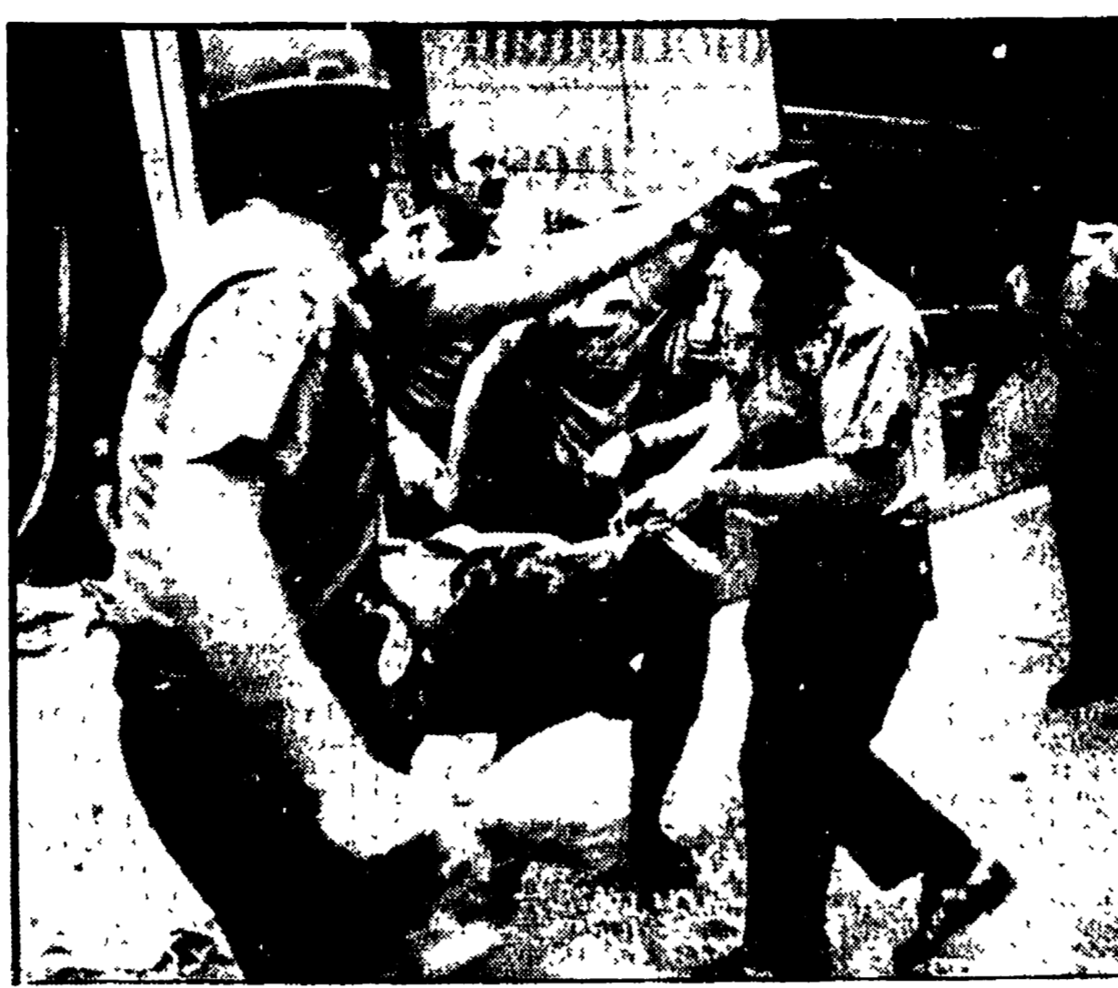
NEW YORK — Agenti di polizia trasportano su un'improvvisata barella il corpo di una vittima dell'attentato al grattacielo della Mobil Oil