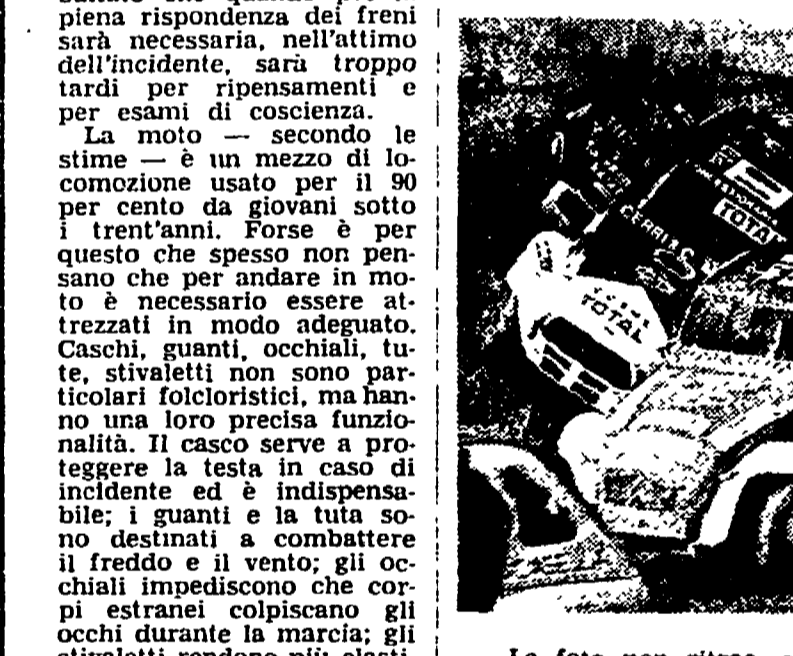
Il 14 agosto, dal Covent Garden di Londra, prenderà il via la Londra-Sydney, giunta con cinque anni di ritardo in un'edizione speciale. Il singolare rally (30.000 chilometri, 30 giorni di guida, 14 Paesi da attraversare) sarà condotto da un'equipaggio australiano (in alto) e patrocinato dalla Singapore Airlines, che quest'anno compie i trent'anni di attività.