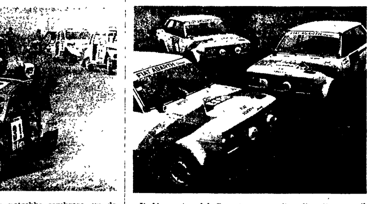
Il 14 agosto, dal Covent Garden di Londra, prenderà il via la Londra-Sydney, giunta con cinque anni di ritardo in un'edizione speciale. Il singolare rally (30.000 chilometri, 30 giorni di guida, 14 Paesi da attraversare) sarà condotto da un'equipaggio australiano (in alto) e patrocinato dalla Singapore Airlines, che quest'anno compie i trent'anni di attività.