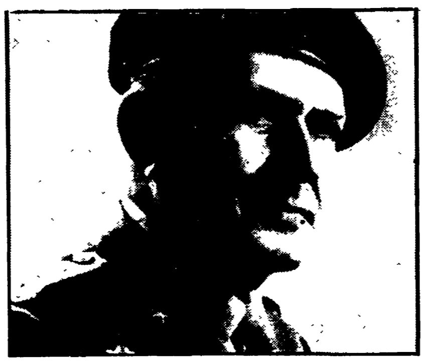
Il generale di corpo d'armata Antonino Anzà

E' Antonino Anzà, candidato alla carica di capo di S.M. dell'Esercito - Inchiesta della magistratura