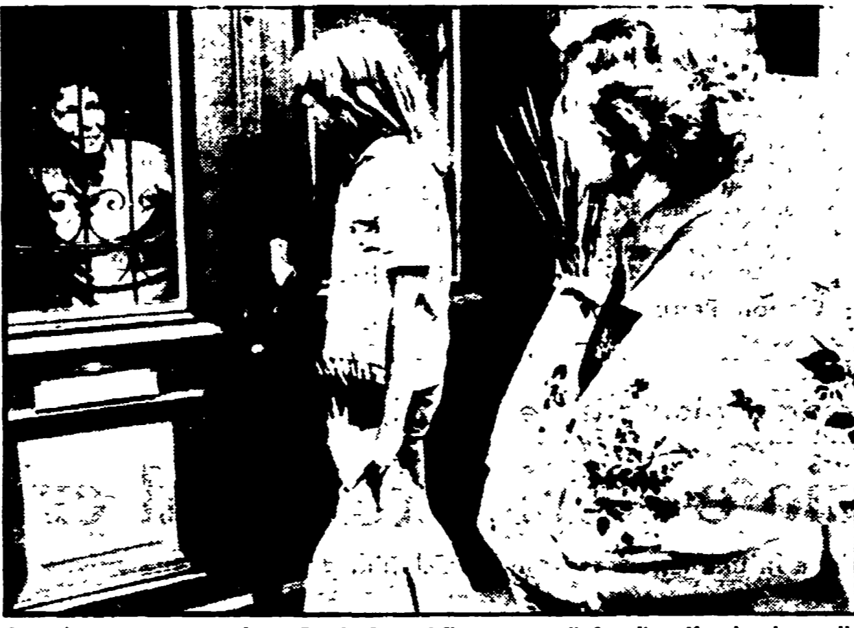
Ha più o meno l'età di Anna Frank. Porta i fiori a casa di Anneliese Kappler, la moglie del criminale nazista, a Soltau. Anche se forse non sa quali responsabilità si assume, questa ragazza diventa il simbolo, insieme alla madre, di quei settori dell'opinione pubblica tedesca ancora inquinati da nostalgie per il regime nazista e pervicacemente insensibili ai traumi insegnamenti che è un orrologio alle vittime dei campi di sterminio...

giornale, riferisce una corrispondenza da Roma: il senso di offesa, la reazione di giudizio che si tradita in rispetto delle istituzioni democratiche e della volontà popolare che si levano da ogni parte d'Italia.