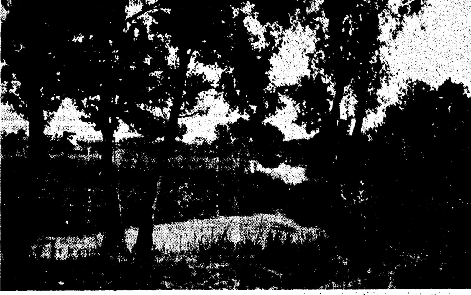
Uno scorcio delle valli di Argenta e Marmorta: boschi e corsi d'acqua a perdita d'occhio.

L'importante iniziativa all'approvazione della Regione - Ogni anno oltre 80.000 visitatori - 1.600 ettari ripopolati di specie di migratori ritenute scomparse