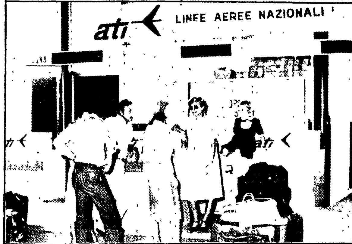
Viaggiatori in attesa di partire all'aeroporto di Reggio Calabria