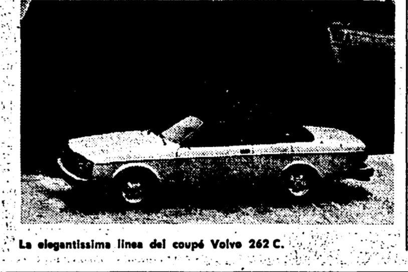
La elegantissima linea del coupé Volvo 262 C.

Per festeggiare il giubileo, la Volvo ha realizzato una serie di modelli di grandissimo livello: un coupé, il 262 C, praticamente inaccessibile alla generalità degli automobilisti.