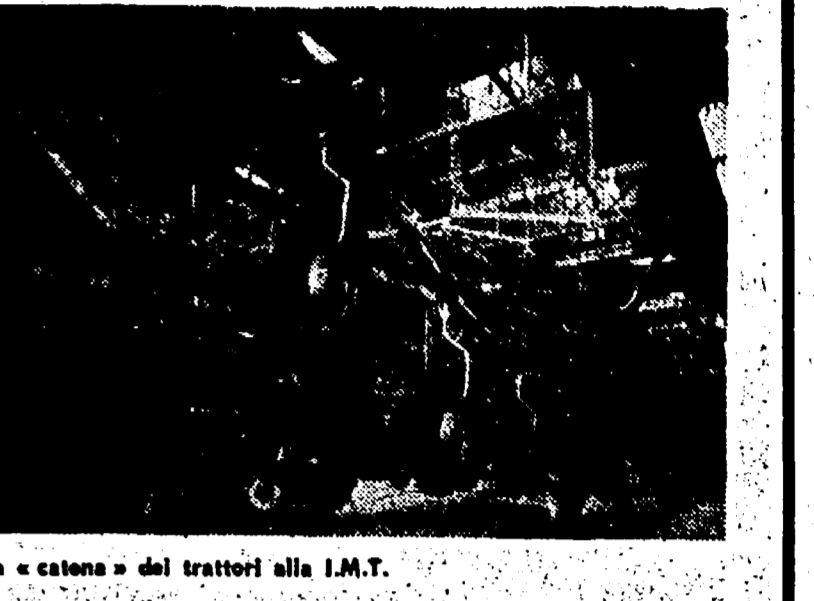
La «catena» dei trattori I.M.T.

Ha una capacità produttiva annua di 40.000 unità - Costruiti sette modelli