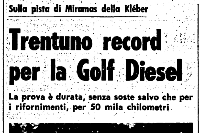
Sulla pista di Miramas della Kléber

Esternamente la Volvo 244 DL del Cinquantenario si riconoscono per il particolare colore opaco, l'arricchimento, per il profilo nero e oro delle fiancate, e per i pneumatici più larghi.