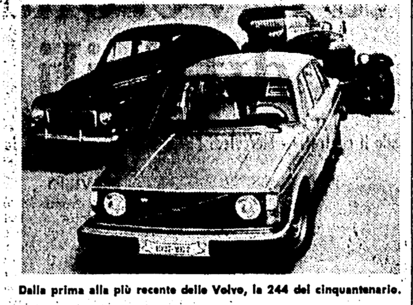
Dalla prima alla più recente delle Volvo, la 244 del cinquantenario.

La Volvo festeggia quest'anno il cinquantesimo anniversario di attività. È stato infatti il 14 aprile 1927 che dalla catena di montaggio dello stabilimento di Göteborg è uscita la prima vettura della casa svedese.