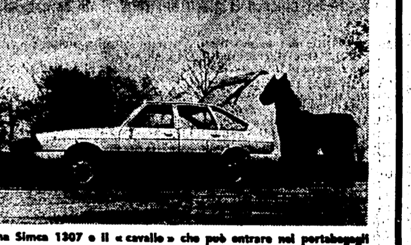
Una Simca 1307 e il «cavallo» che può entrare nel portabagagli della 1308.

Modestia nei consumi e capacità di carico tra le ragioni del successo delle vetture