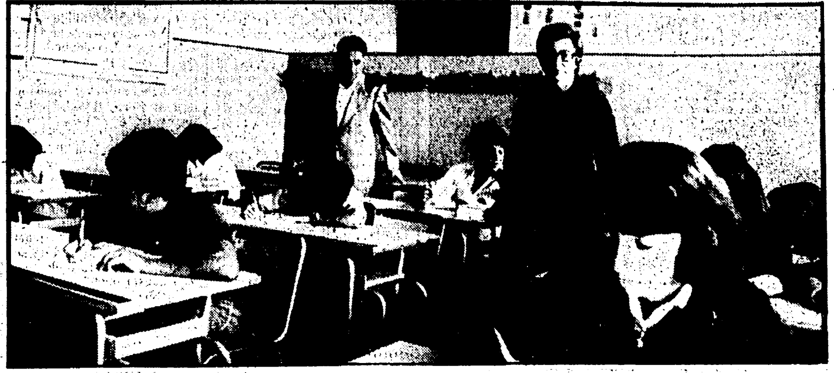
ROMA — Sono cominciati ieri gli esami di riparazione con la prova di italiano, scritto per tutti coloro, fra i 500 mila rimandati, che non avevano ottenuto a giugno la sufficienza in questa materia...

Nelle elementari e nella media dell'obbligo verrà abolito per la prima volta l'antico criterio di valutazione: sarà sostituito da una scheda trimestrale che traccerà il profilo di ogni alunno - L'apertura anticipata al venti settembre e i «ritocchi» delle materie di studio - L'elezione dei distretti