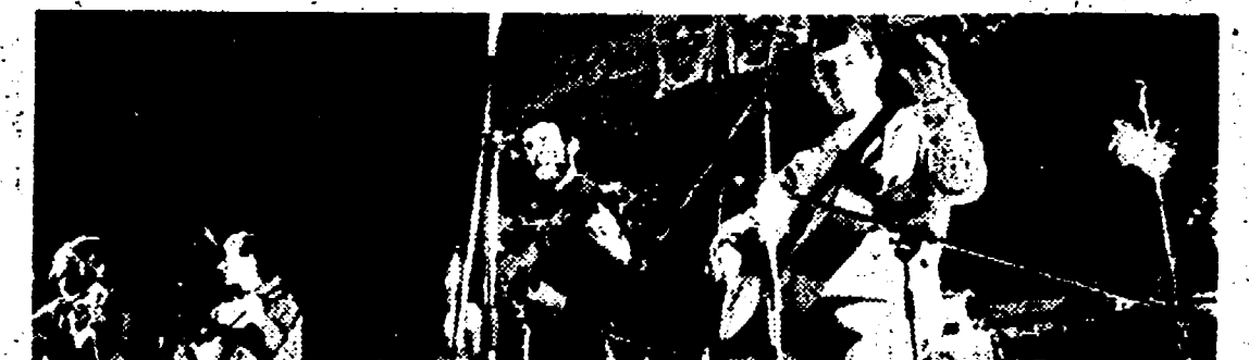
Gli Stormy Six

PADIGLIONE B PALAZZO DELLO SPORT, ore 20 — Torneo di pallavolo femminile con Lokomotiv di Sofia, squadra jugoslava, Co-ma e Nelsen.