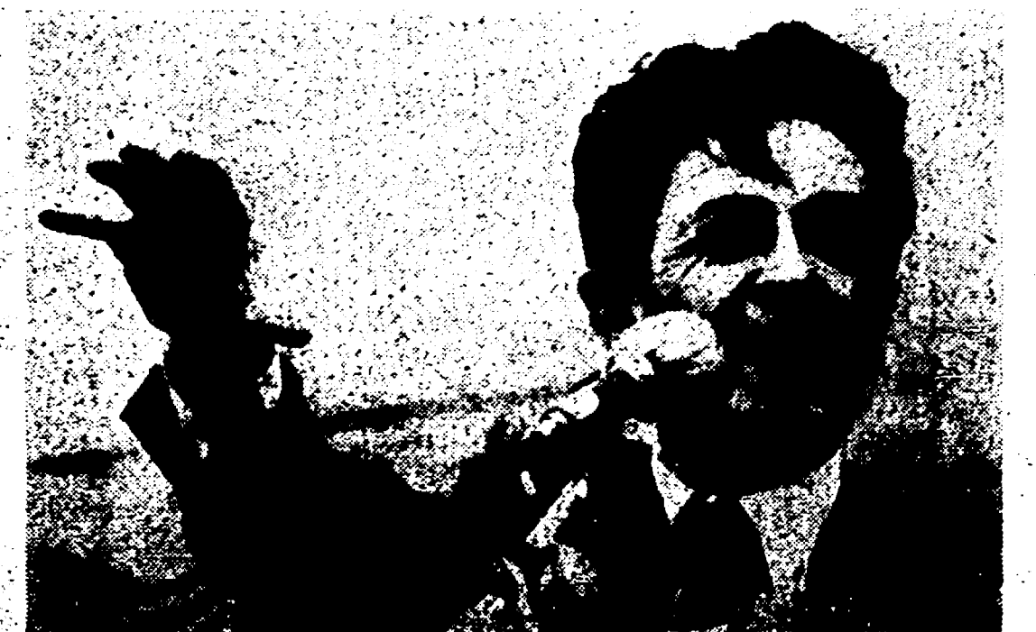
Il compagno Enrico Berlinguer

ARENA SPETTACOLI (G), ore 21 — Recital di Anna Identici.