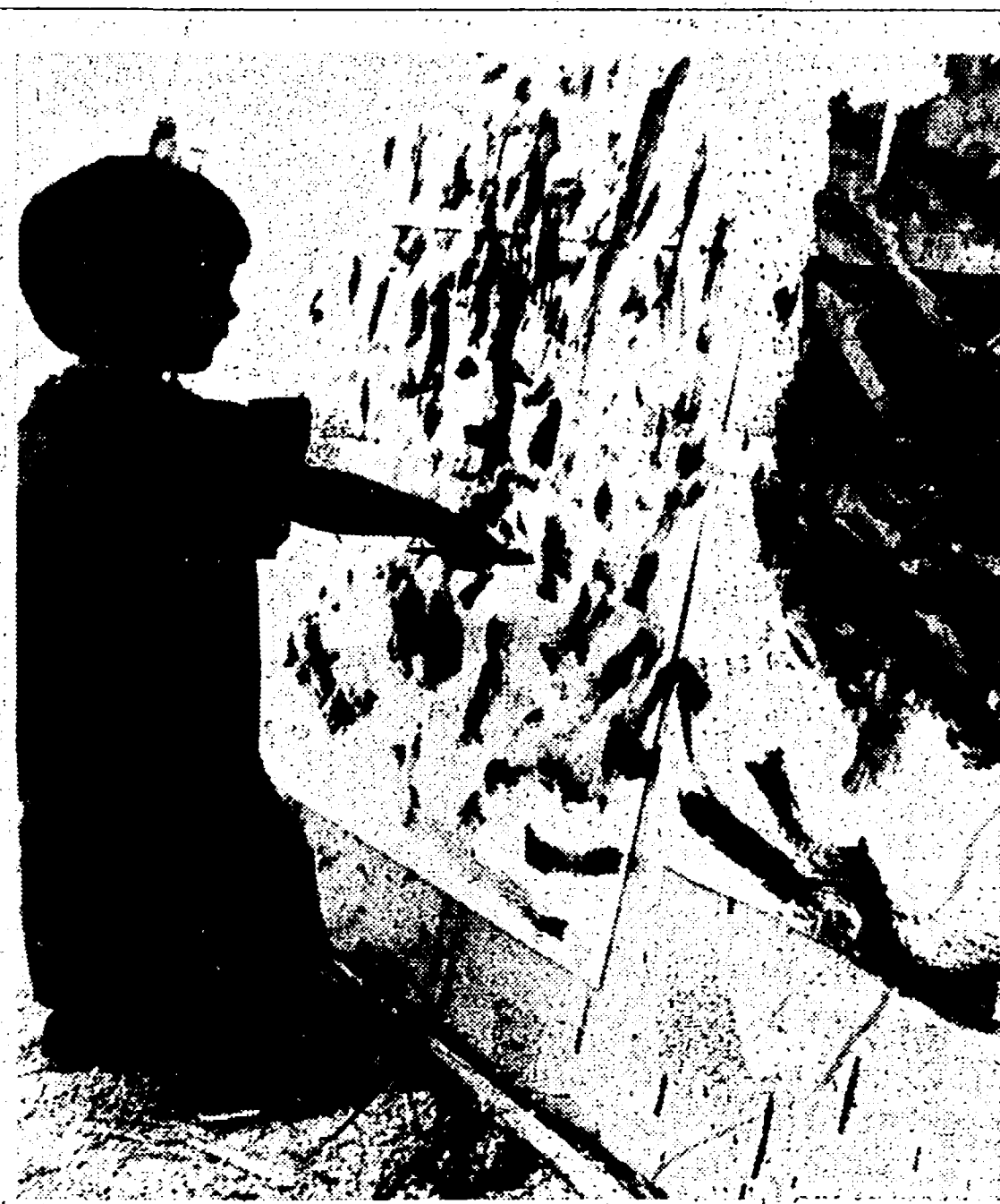
Festival nazionale dell'Unità, Napoli, 1976.