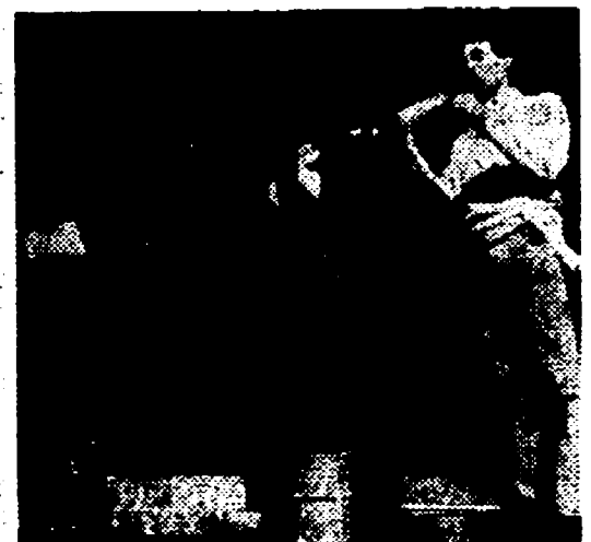
Tre componenti del Nuovo Canzoniere

STADIO BRAGLIA, ore 21 — Finale Torneo di calcio.