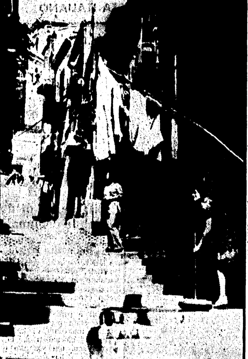
CALTANISSETTA - Una strada del quartiere «Misericordia» dove si sono registrati i primi casi di tifo.