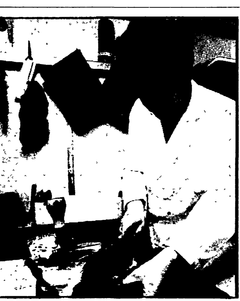
Nuovi ricari della carne di primo taglio si registrano a Cagliari. La città sarda sta diventando una delle più « care »

L'operazione della questura avrebbe dato esito negativo - Restano molti sospetti sui traffici tra tossicomani e alcune infermiere