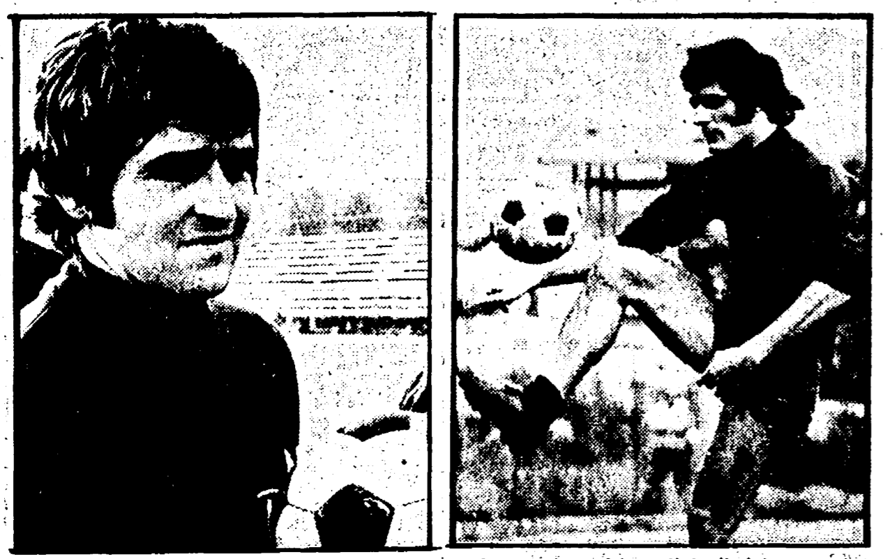
Il confronto tra De Sisti e Claudio Sala sarà un altro dei motivi di interesse

FOREST HILLS — Guillermo Vilas si è qualificato per la finale del singolare maschile agli Open di Forest Hills imponendosi per 6-2, 7-6, 7-6. L'americano Harold Solomon. Il mancino argentino avrà di fronte il vincitore della seconda semifinale tra Corrado Barazzutti e l'americano Jimmy Connors.