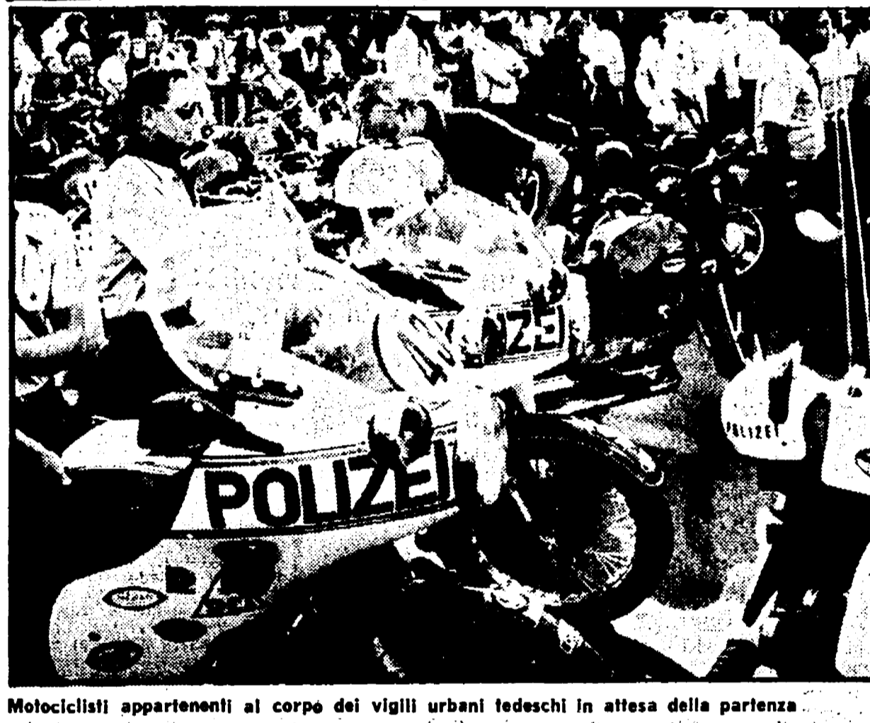
Motociclisti appartenenti al corpo dei vigili urbani tedeschi in attesa della partenza