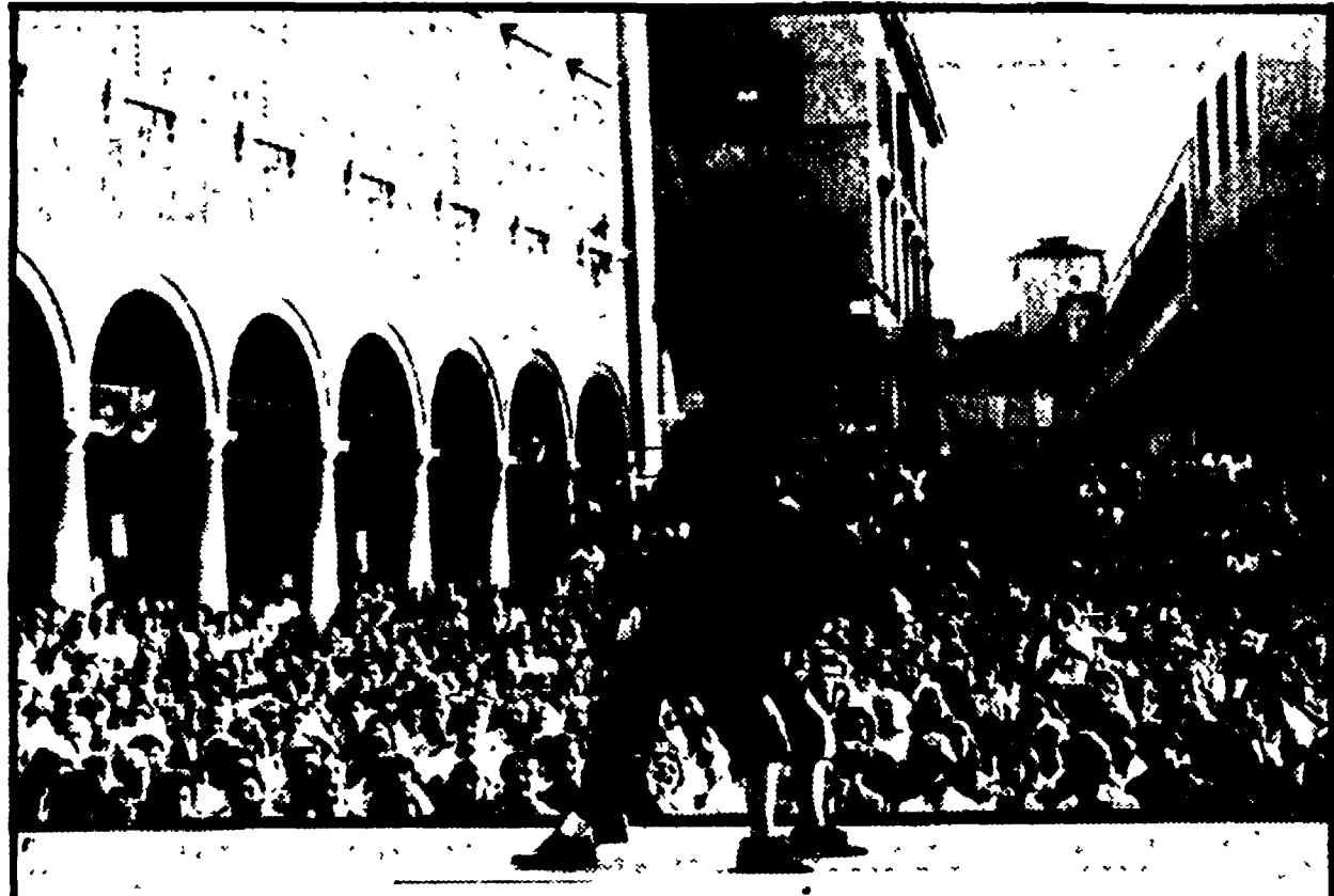
MODENA — I clown di un gruppo partecipante al Festival nazionale dell'Unità si esibiscono davanti al pubblico nel centro cittadino.