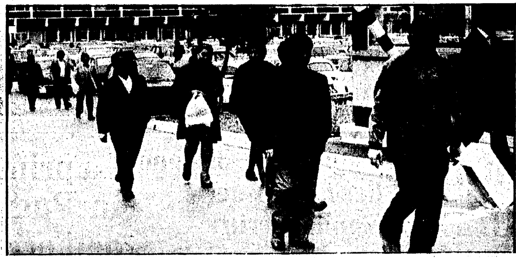
Operai all'uscita dallo stabilimento Marelli. Nella foto in alto accanto al titolo: l'azienda SIV di San Salvo