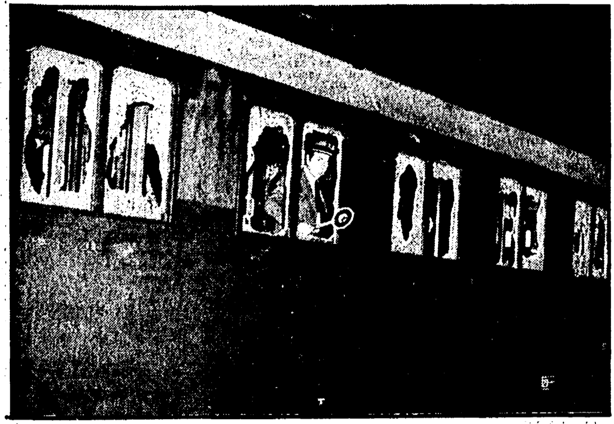
Una delle vetture del treno messo a soqquadro dai teppisti