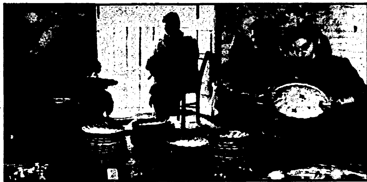
CASTELLI - Il delicato lavoro di rifinitura delle maioliche

La trascuratezza, che per dura tuttora - una statua lignea di Sant'Anna, restaurata di recente dalla soprintendenza dell'Aquila, è stata custodita in una chiesa, un prezioso esemplare del 200 è esposto ai venti e alla corruzione degli elementi della facciata...»