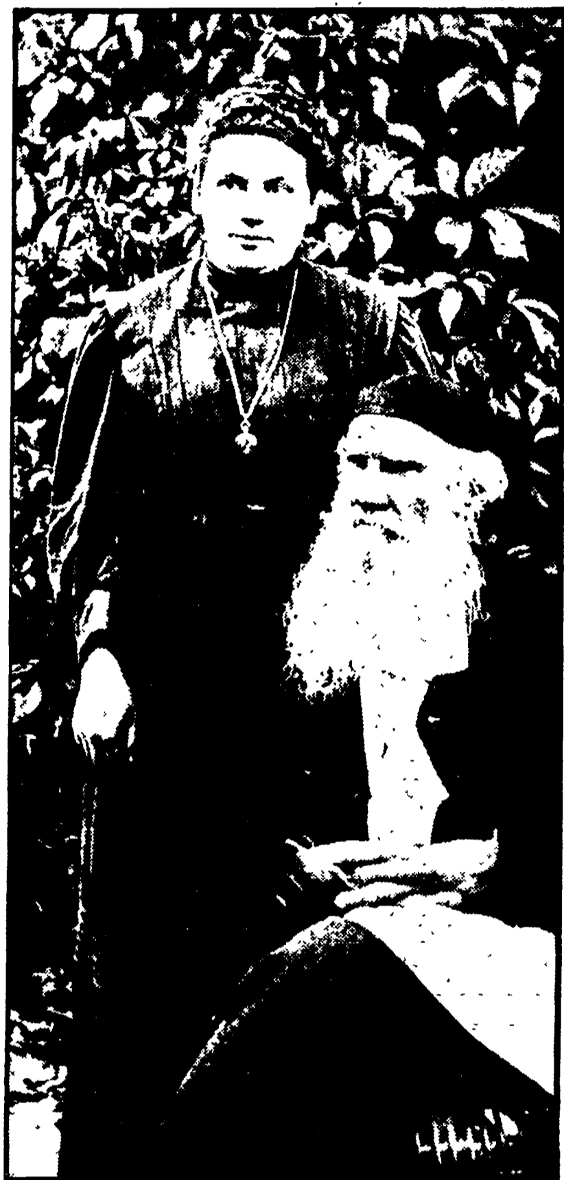
Leone Tolstoj con la figlia Alessandra

Un ritratto inedito e talvolta abbastanza sconcertante del grande scrittore russo attraverso le pagine della sua vita privata