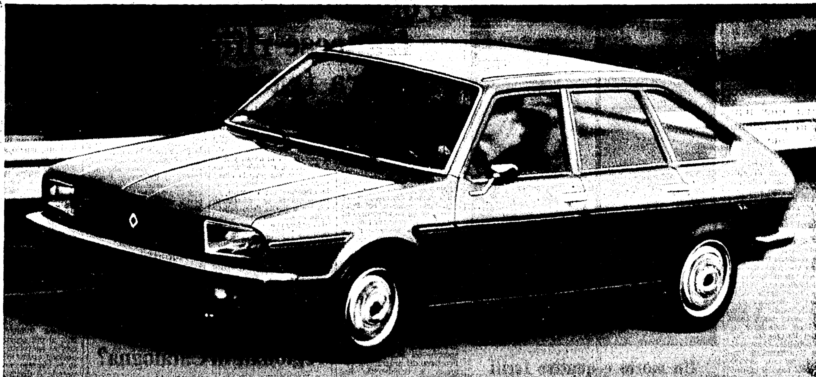
La Renault 20 TS: una moderna e potente stradista con eccezionali doti di confort, abitabilità e sicurezza.