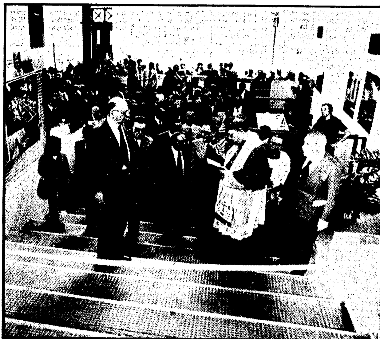
Il sindaco Valenzi e il cardinale Ursi durante la cerimonia inaugurale

Il sindaco Valenzi e il cardinale Ursi hanno presenziato alla cerimonia - L'impianto è completamente automatizzato - L'agitazione di 5 manovratori rischia di bloccare tutto