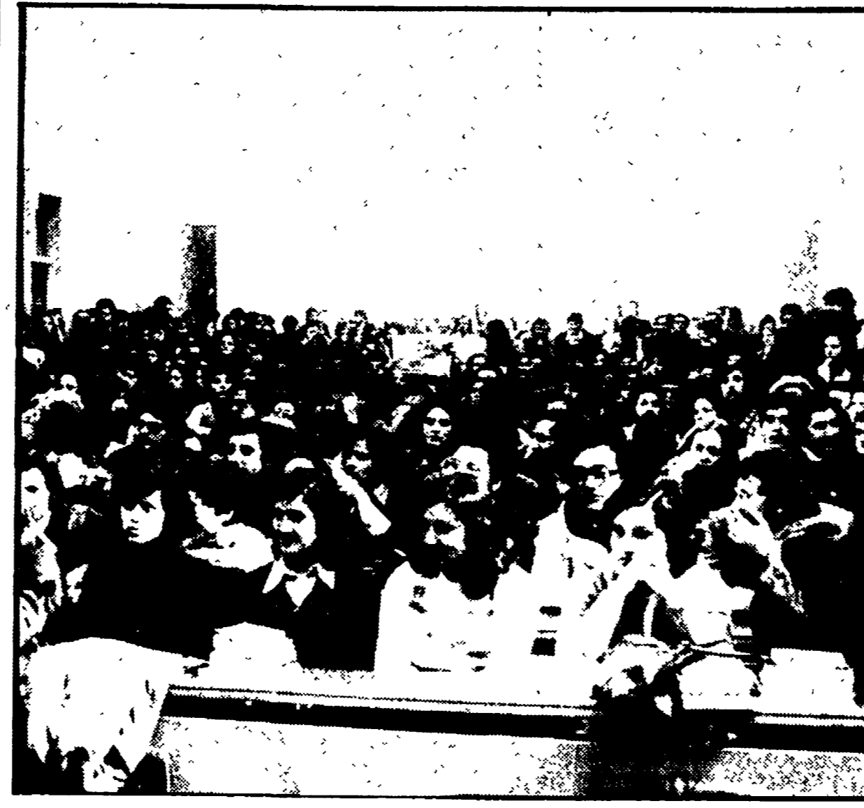
Un'immagine delle lezioni all'università di Bari

Un incarico durato otto anni durante i quali si sono addensati problemi enormi: la crescita dell'ateneo, le spinte di studenti e docenti per l'affermarsi di un regime democratico, il problema di un rapporto vivo con la città e la regione