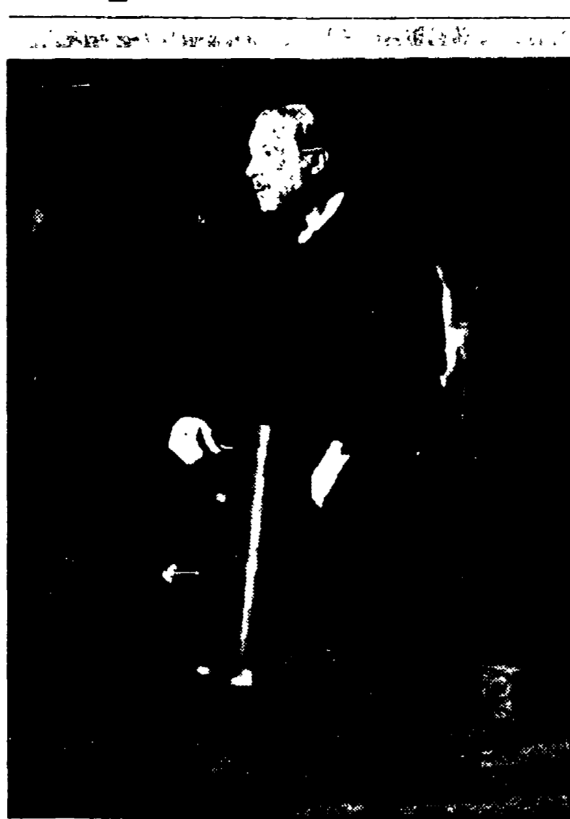
Romolo Valli durante le prove dell'«Enrico IV»