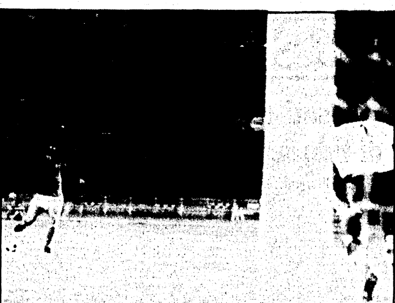
PAOLO ROSSI mette a segno il suo primo gol nella partita con l'Under 21 jugoslavi