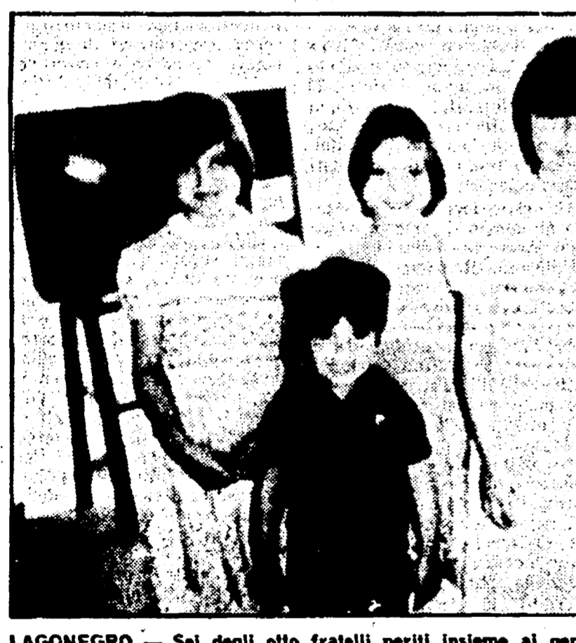
LAGONEGRO - Sai degli otto fratelli periti insieme ai genitori e allo zio. A destra: il «volo» della Taunus dal viadotto alle alcune decine di metri

Deceduti tutti gli otto figli, il primo di 15 e l'ultimo di due anni - A colloquio con la nonna in una stanza povera