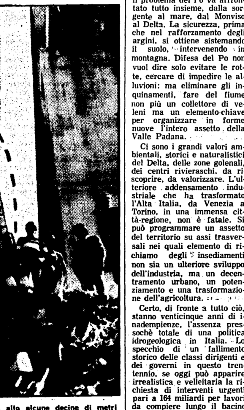
LAGONEGRO - Sai degli otto fratelli periti insieme ai genitori e allo zio. A destra: il «volo» della Taunus dal viadotto alle alcune decine di metri