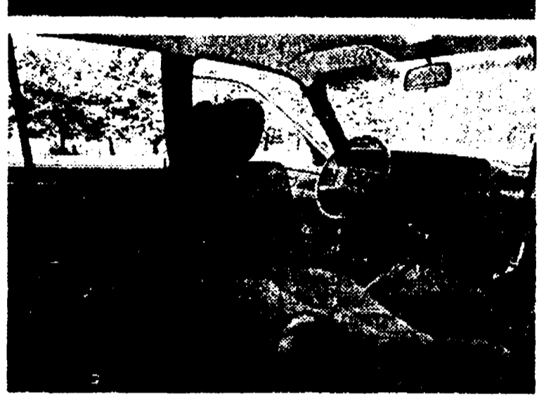
Nella foto in alto: la nuova linea della Opel Rekord Diesel. In basso: l'interno della Rekord «Berlina» con cambio automatico.

Punta all'estero la Casa di Tavernelle V.P.