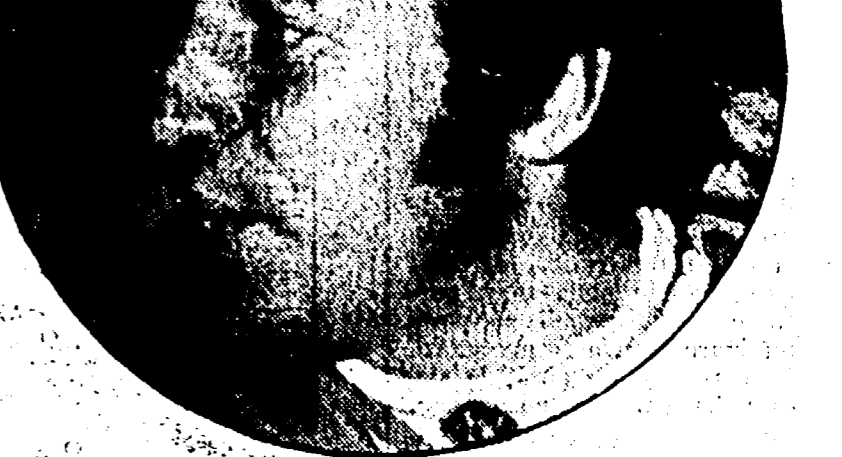
MARIO ANDRETTI ha fatto registrare ieri il miglior tempo nelle prove del G.P. del Giappone